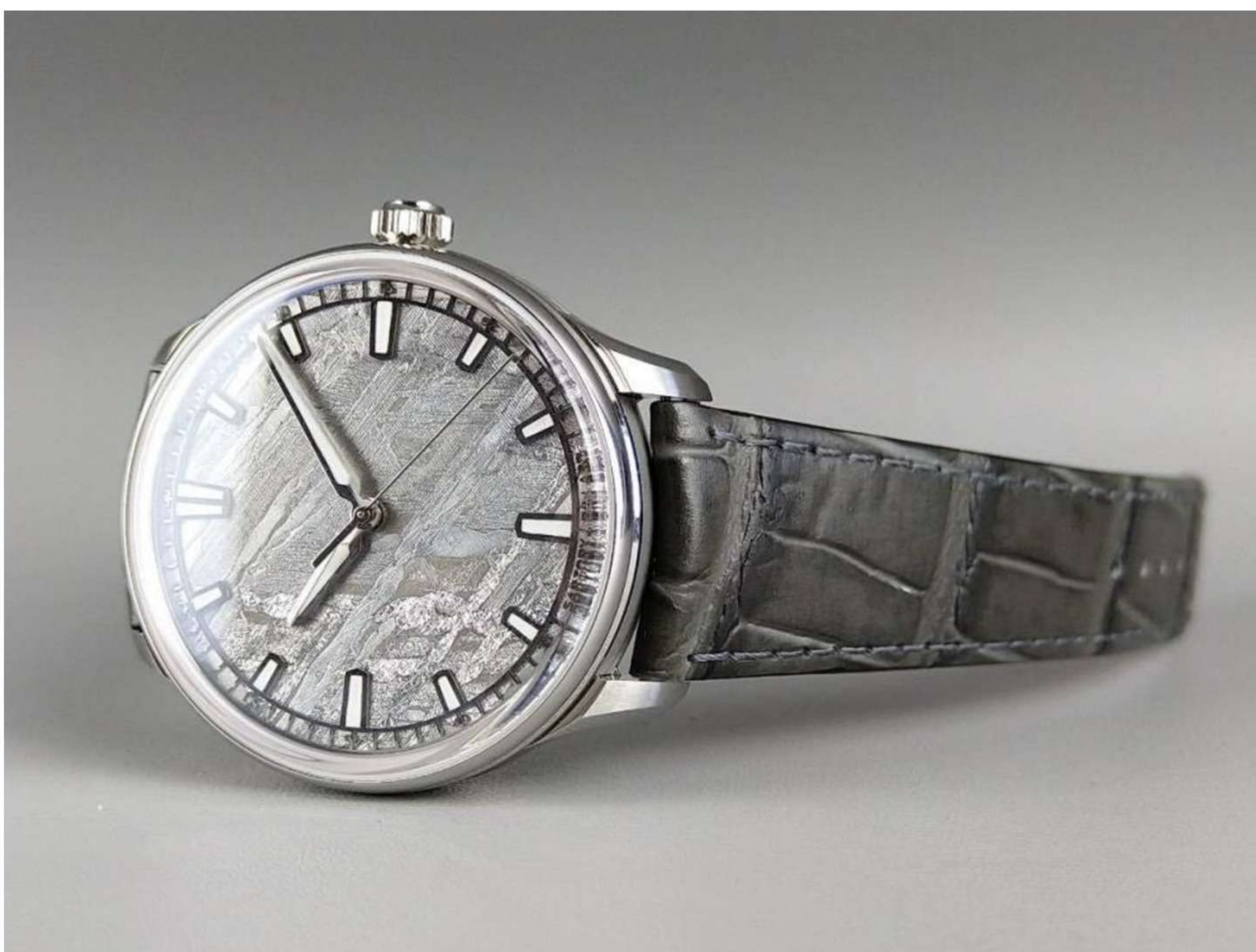
Sartory Billard SB04 © LPM