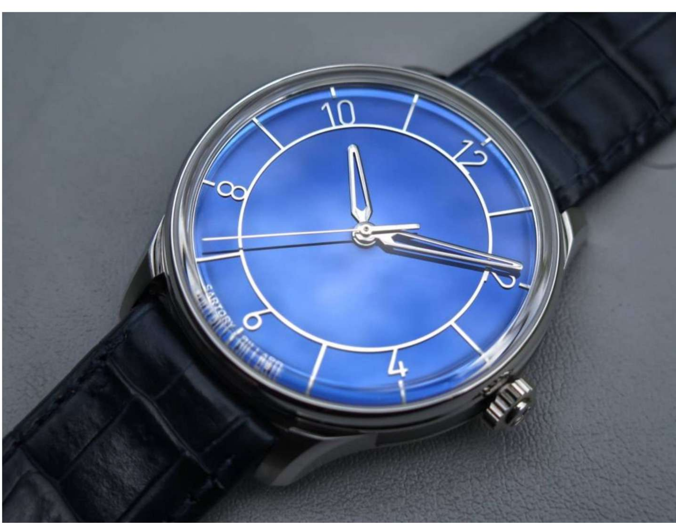
Sartory Billard SB04

En vous inscrivant, vous acceptez les conditions générales d'utilisations et notre politique de confidentialité.