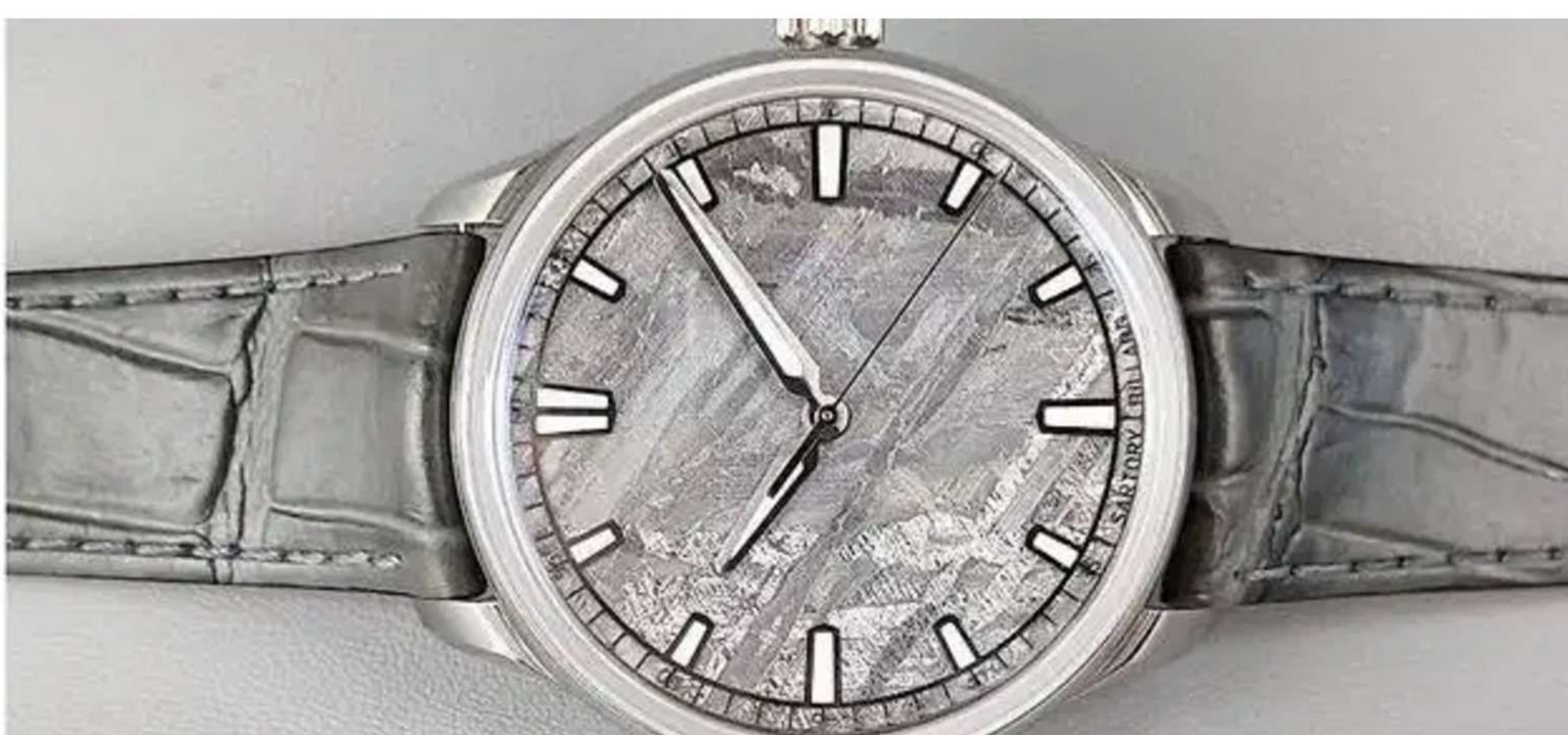
Sartory Billard SB04, un cadran taillé dans une météorite.

Publié le 07/07/2019 à 23h19, mis à jour le 07/07/2019 à 23h23